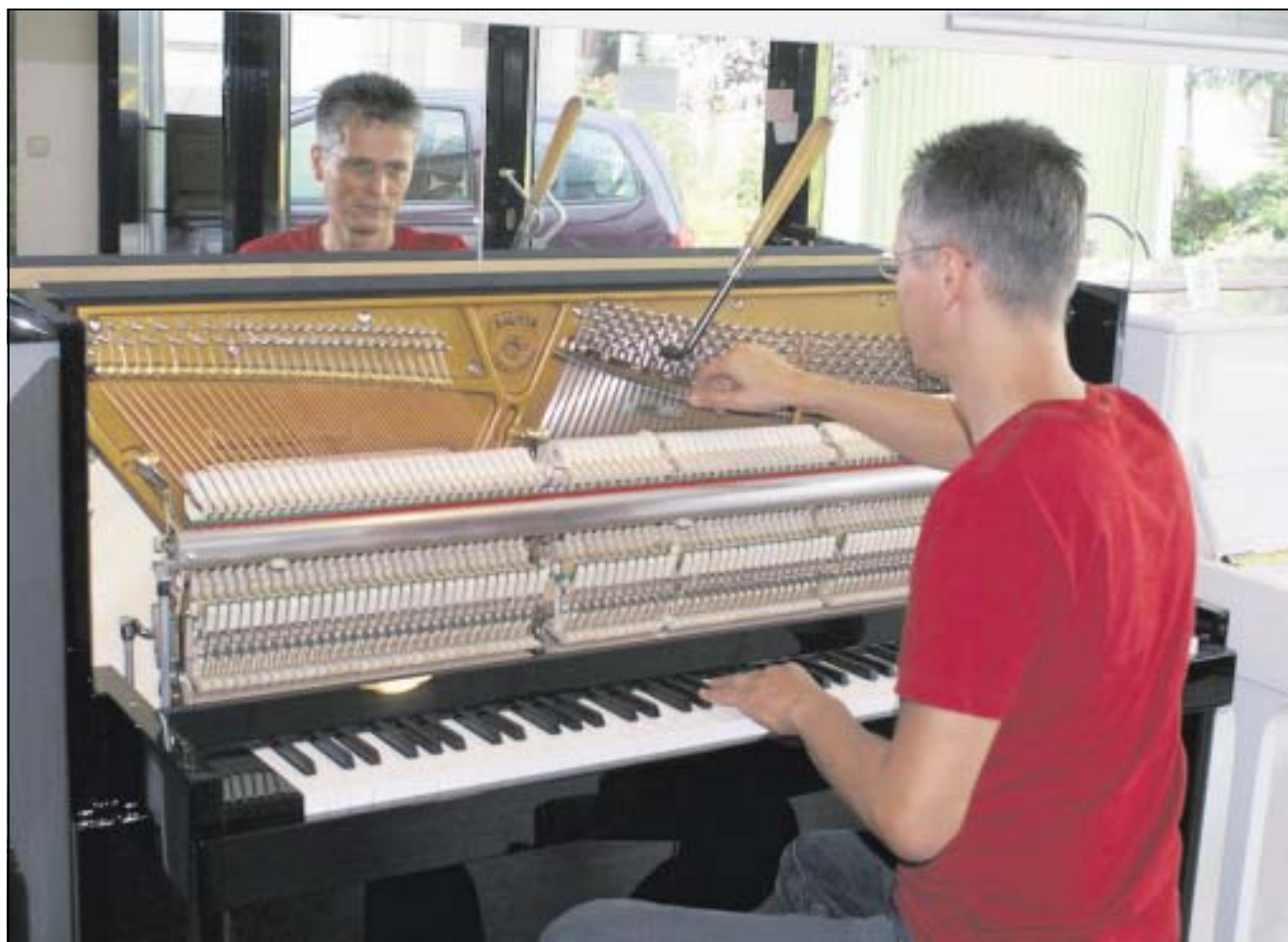
Ein gutes Gehör ist die Voraussetzung für einen guten Klavierstimmer. Das Stimmen nach Gehör ist nach wie vor ein Schwerpunkt.