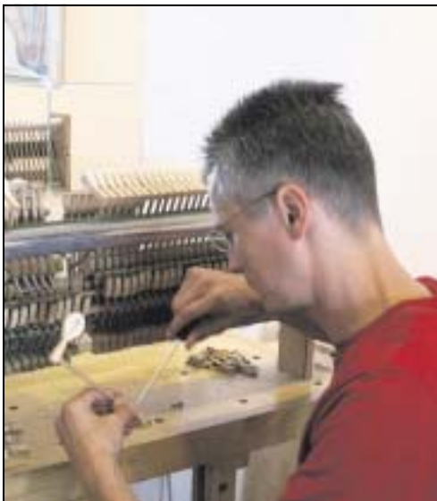
Die Mechanik des Klaviers besteht aus ca. 6000 Einzelteilen.